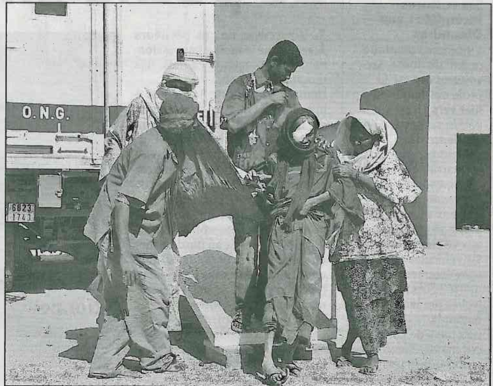
Depuis qu'elle a débuté ses missions chirurgicales en Afrique, l'association cannoise a permis d'opérer et soigner directement sur place plus de 2000 personnes.